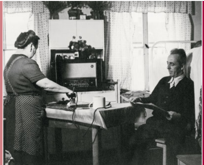
Lager Massen im September 1954. Eintrag von Deutschen aus Rumänien in die Lob- und Beschwerdebücher.

„Wir wandern schon vierzehn Jahre umher und finden keine Heimat mehr. Nach sieben Monate und eine Woche Aufenthalt im Lager Massen wollen wir Abschied nehmen und nach Neheim Hüsten weiterziehen um dort endlich unsere neue Heimat zu finden.“