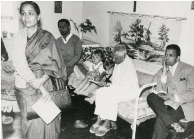
Eine indische Regierungsdelegation besichtigt 1962 das Modelllager Unna-Massen.

Von der Öffentlichkeit besonders wahrgenommen werden in den 1970er Jahren die Chile-Flüchtlinge bzw. die Boat People und die Flüchtlinge aus dem Balkan in den 1990ern.