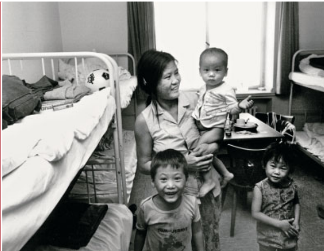
Vietnesin mit Kindern in der Außenstelle Bergkamen-Oberaden 1979

Im Frühjahr 1979 gründet der deutsche Journalist Rupert Neudeck zusammen mit Schriftstellern wie Heinrich Böll in Troisdorf bei Köln das private Hilfskomitee „Ein Schiff für Vietnam“. Sie möchten, nach dem Vorbild eines französischen Hilfsschiffes, dem Sterben und Ertrinken im Chinesischen Meer ein Ende machen. Die deutsche Bevölkerung lässt sich