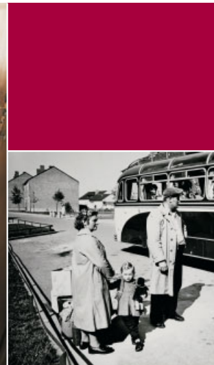
Ankunft im Lager Massen.