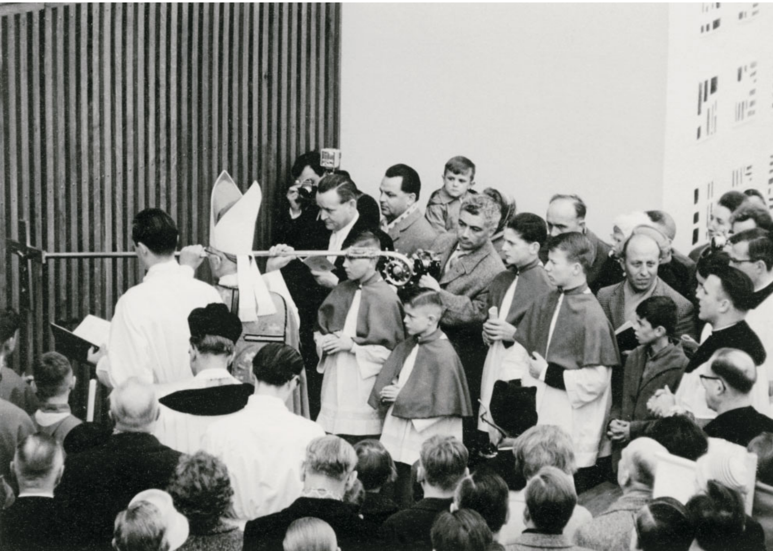
Am 30. März 1963 weiht der Erzbischof von Paderborn Kardinal Dr. Lorenz Jäger die neugebaute katholische Kirche in der Landesstelle der Heiligen Hedwig.