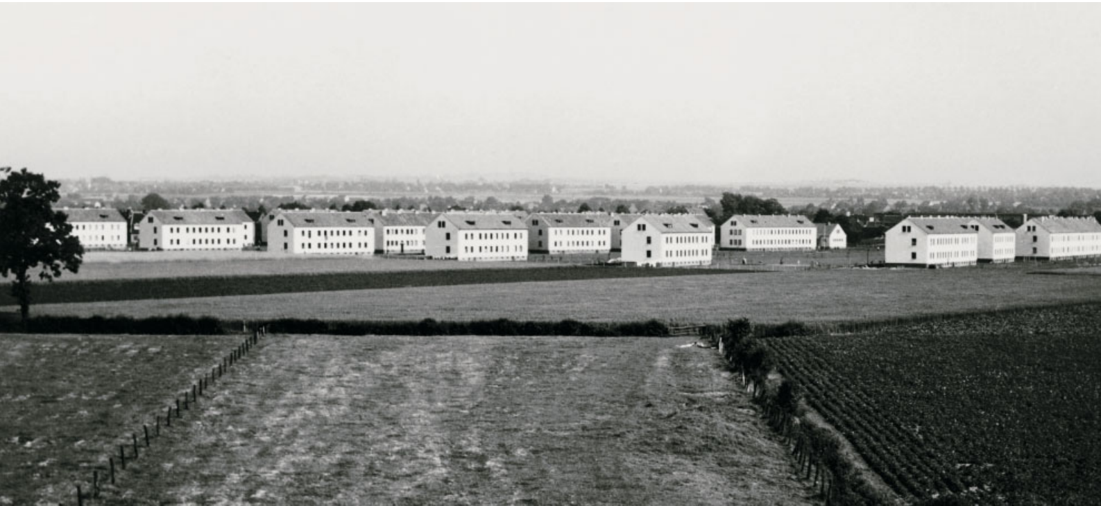
Hauptdurchgangslager Unna-Massen, Ausdehnung nach Beendigung des ersten Bauabschnittes 1951.