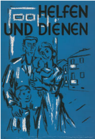
Titel der Chronik der Landesstelle aus dem Jahr 1959.

Während des Krieges leben etwa 10 Millionen Deutsche in Polen (Ostproußen, Pommern, Nieder- und Oberschlesien, Ostbrandenburg, Danzig und andere Gebiete). Nach Kriegsende müssen zwischen 1945 und 1950 ca. 3,6 Millionen Deutsche aus Polen sowie aus Ostdeutschland fliehen oder werden vertrieben. Tausende finden dabei den Tod.