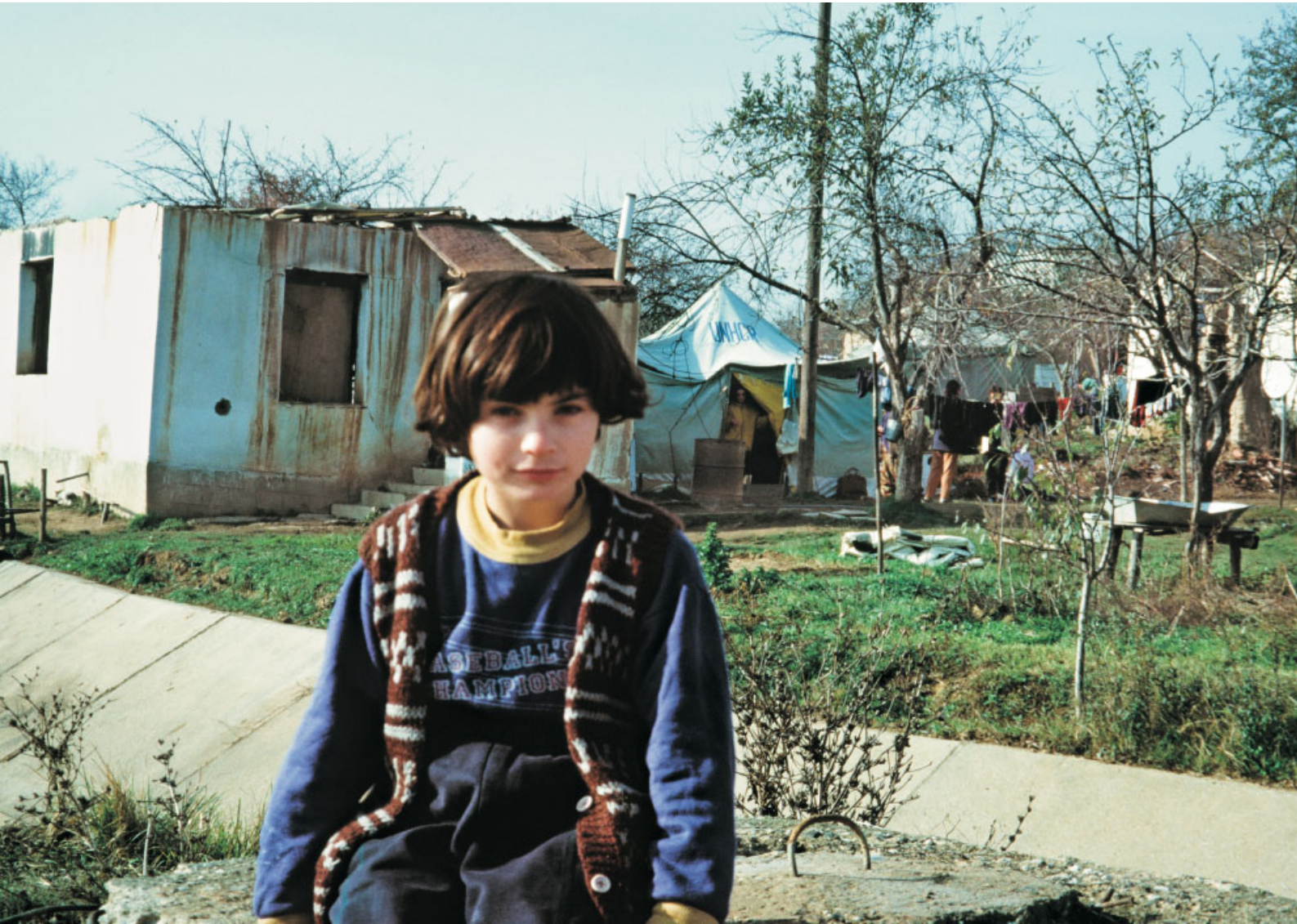
Zurück aus Unna im Kosovo. Im Hintergrund das ausgebrannte Haus. Die Familie lebt in dem blauen Flüchtlingszelt, eine Spende des UNHCR. Die Caritas aus der Landesstelle liefert per LKW den Hausrat aus Spenden.