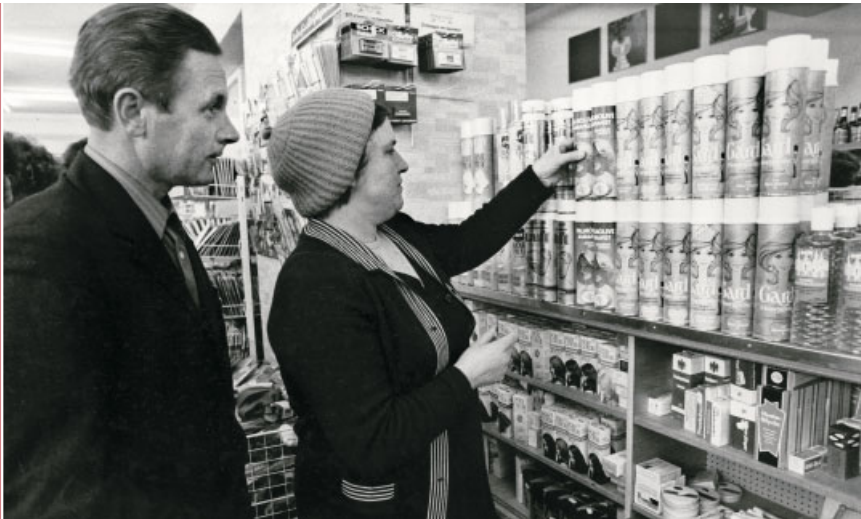
Von allem soviel – ein Aussiedlerpaar staunt über das Warenangebot in einem Massener Geschäft.

Begleitheft zu einer Tagung des Steinbacher Kreises in Waldbröl 1965. Faltblatt des Deutschen Roten Kreuzes, herausgegeben 1989.